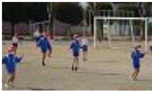
・縄跳び大会に向けて