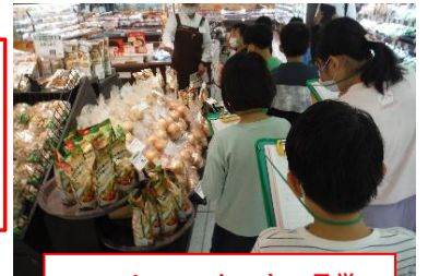
スーパーマーケットの見学